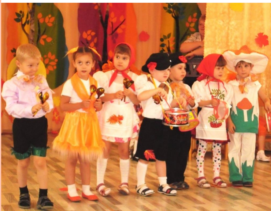
Р.н.п. «Ах, ты берёза», исп. средняя гр. №7