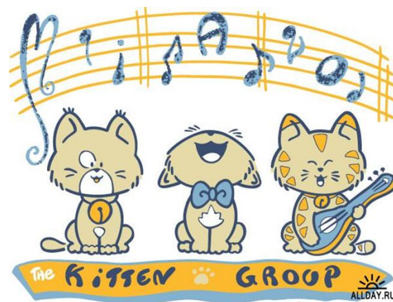
Н. Богословский «Песня старого извозчика», исп. подг. гр. №9