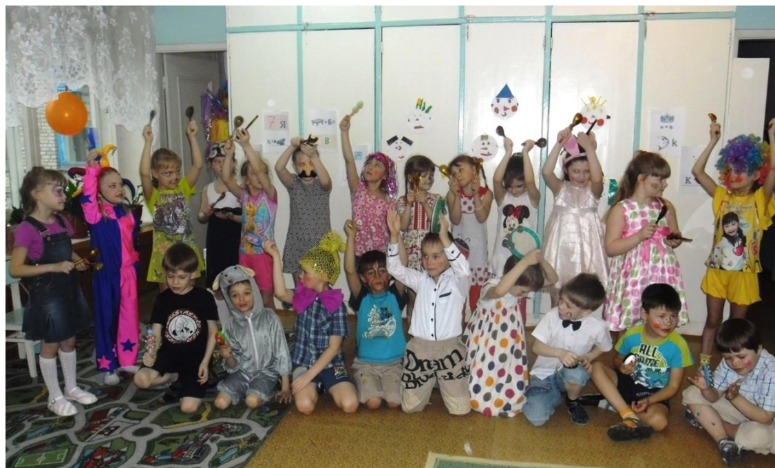
Д. Кабалевский «Клоуны», исполняет подг. гр. №9