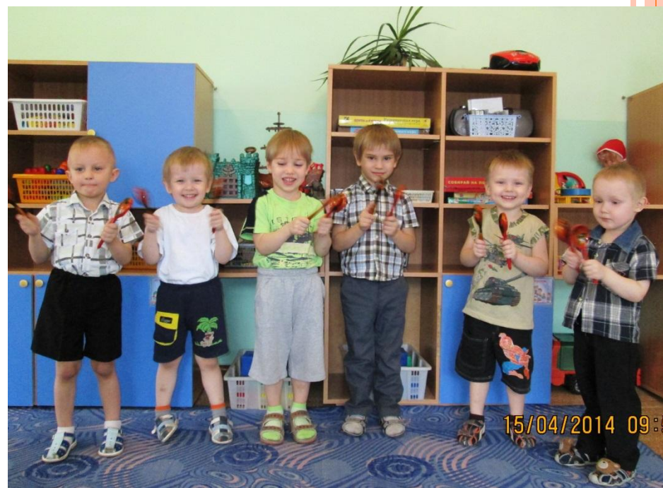
Ансамбль ложкарей, р.н.п. «Калинка», исп. млад. гр №10