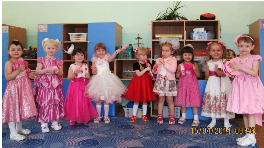
Р.н.п. «Как у наших, у ворот», исп. млад. гр.№10